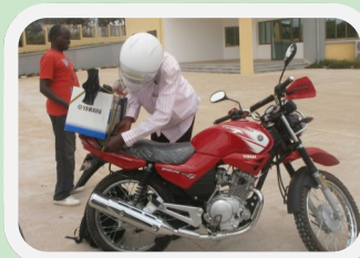
Remise des motocyclettes aux animateurs paysans

tion de poussins. 850 poussins ont été vendus aux éleveurs à prix subventionné (400 F au lieu de 1000 F) pour la production d'œufs de table, d'œufs fécondés et de poulets de chair.