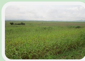
Mission des fermes pilotes dans le district de Loutété—janvier

demandeurs seront appuyés dans la définition technique et économique de leur projet et dans la montage de leur dossier.