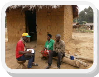
Identification des bénéficiaires, Kindamba, juillet 2013

226 bénéficiaires du PROFAP ont été identifiés pendant les mois de juillet, août et septembre: