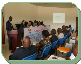
Séminaire d'ouverture du PROFAP, Conseil Départemental du Pool, le 16 Avril 2013.

Le 16 avril 2013 s'est tenu au Conseil Départemental du Pool, à Kinkala, le séminaire d'ouverture du PROFAP sous la présidence du Président du Conseil Départe-