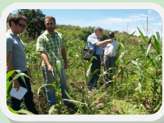
Mission du Directeur de l'Ircod et du Chargé de mission dans le Pool, avril 2013.

A l'occasion des Journées d'été du 04 et 05 septembre, les outils de suivi des Indicateurs Objectivement Vérifiables (IOV) élaborés par l'Ircod Congo ont été présentés.