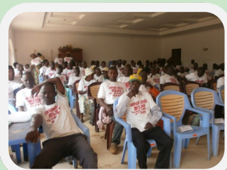
Bourse agricole de Mindouli, le 27 septembre 2013.