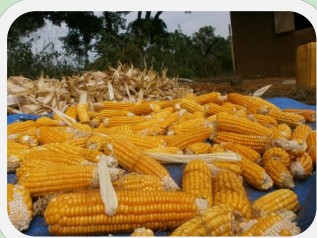
Collecte de maïs jaune—district de Boko—mars 2014