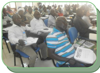
Comité de pilotage—18 avril 2014

Le 18 avril 2014 s'est tenu au Conseil Départemental du Pool à Kinkala, le comité de pilotage du PROFAP, sous la présidence du