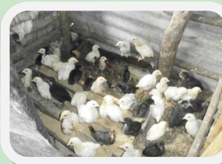
Production de poussins—