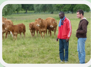
Mission de formation du Chef de projet adjoint en Alsace—juin 2014